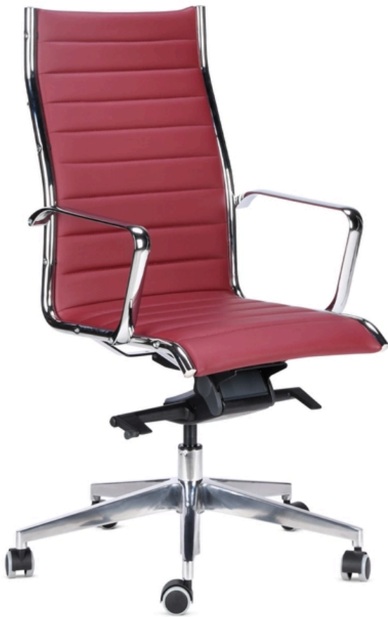
LA FOTO PUO' INCLUDERE OPTIONAL